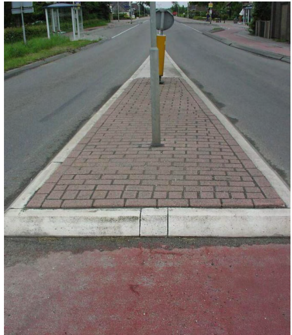
Verkeersgeleider wél behandeld met ProtecDalle

Voor elk product geldt, dat een juiste wijze van verwerking essentieel is voor de uiteindelijke kwaliteit ervan. En kwaliteit is samen met advies en service een sleutelbegrip in de dienstverlening van MixiM. Goede producten verdienen de juiste aandacht bij de verwerking. De technisch adviseurs van MixiM geven u graag ondersteuning. Wij zijn pas tevreden als u het bent!!!!