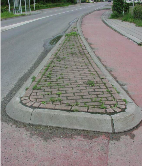
Verkeersgeleider niet behandeld met ProtecDalle